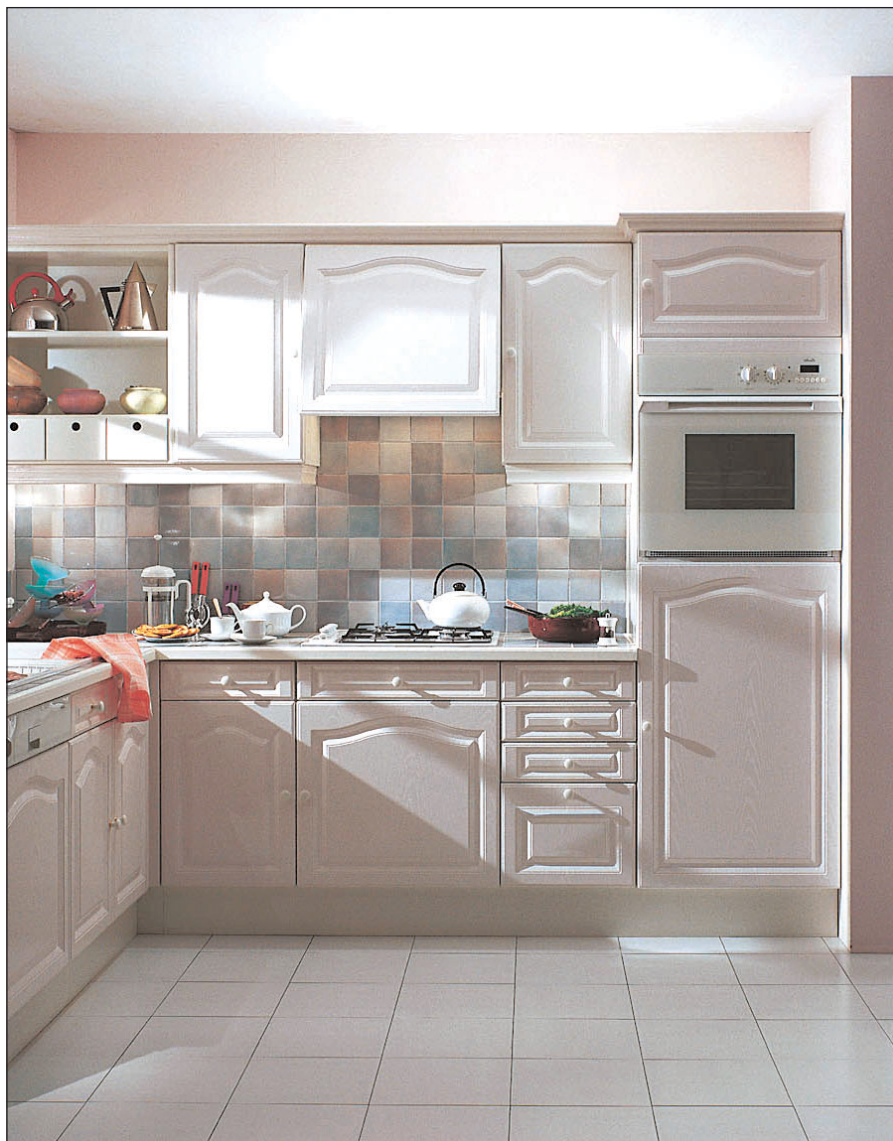
TEXTE H. SÉGURET - PHOTOS M. LOISEAU - OUVERTURE COMERA

● Enfin, n'oubliez pas la sécurité, surtout en présence de jeunes enfants. Un four encastré en hauteur est tout aussi dangereux que celui d'une cuisinière standard, quant aux risques de brûlure des mains ou du visage. Un four à "porte froide", qui ne