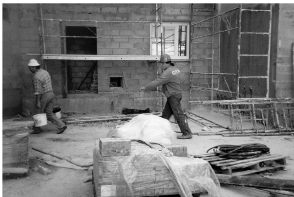
L'importance d'organiser les stockages et les circulations

Dans le cadre du chantier expérimental, il s'agit donc de définir :