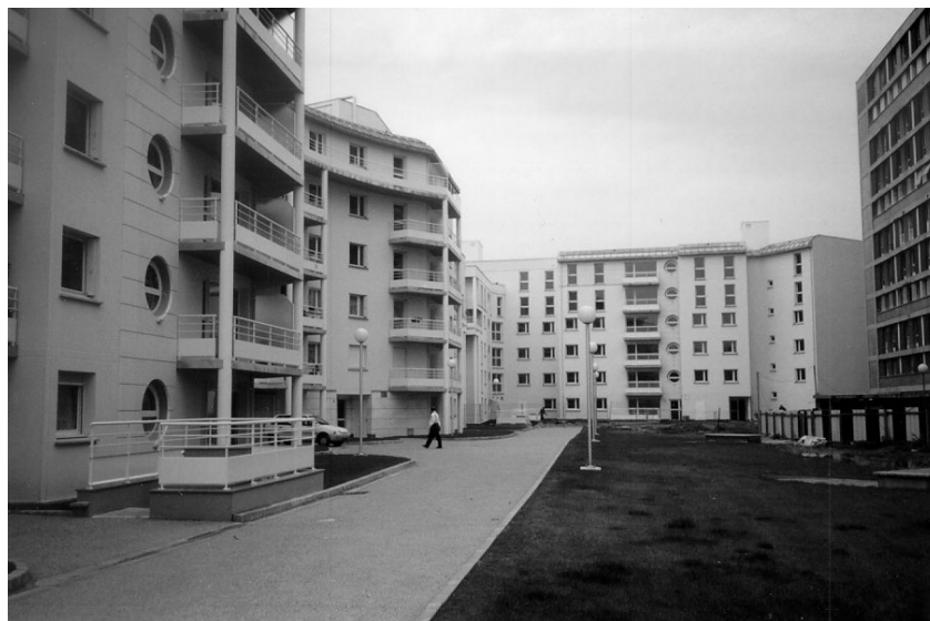
Vue d'une partie de l'ouvrage terminé, bâtiment 1 et 2

Nous nous appuyons sur nos observations pour montrer l'émergence progressive de ces difficultés et discuter des moyens matériels et organisationnels susceptibles de les atténuer.