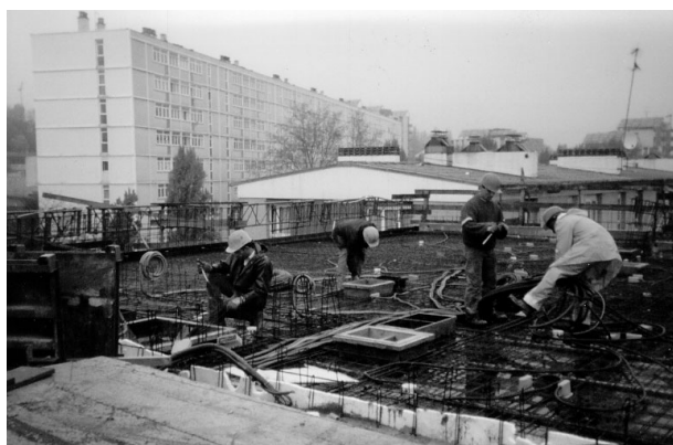
Co-activité entre les différents corps d'état

Au delà de la faible prise en compte des contraintes propres aux sous-traitants dans l'élaboration des plannings, par l'entreprise générale, on peut souligner que, d'une manière générale, la planification du chantier repose sur une vision d'un déroulement optimal, sans incident, de l'avancement des travaux.