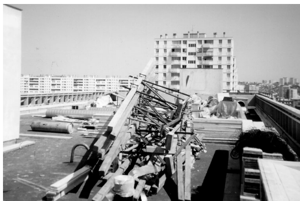
Vue de la terrasse du bâtiment 1, après enlèvement de la grue

L'étanchéiste fut également dans ce cas et la terrasse était toujours encombrée par des matériaux et matériels à la fois lourds et volumineux.