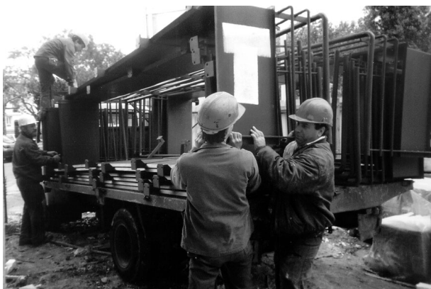
Transport des gardes corps

A l'inverse, le déchargement de 16 garde-corps de 140 kg chacun, gerbés sur un plateau d'un camion de 2,5 tonnes appartenant au serrurier, impose des efforts physiques importants aux ouvriers sur le chantier et le chargement a dû lui-même être aussi pénible.