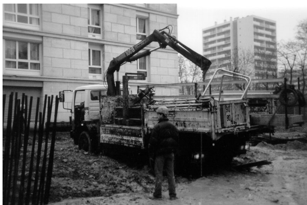
Camion embourbé et camion bloquant l'accès du chantier

Mais, dans le même temps où les manutentions augmentent avec l'accroissement des flux, les voies d'accès et les moyens de transfert se réduisent. En outre, la grue est de moins en moins disponible. Cela peut conduire à des incidents comme celui de l'embourbement d'un camion, ayant nécessité plusieurs heures de travail pour le débloquer, ou encore à des encombrements rendant plus difficiles et surtout plus risqués les déplacements des compagnons.