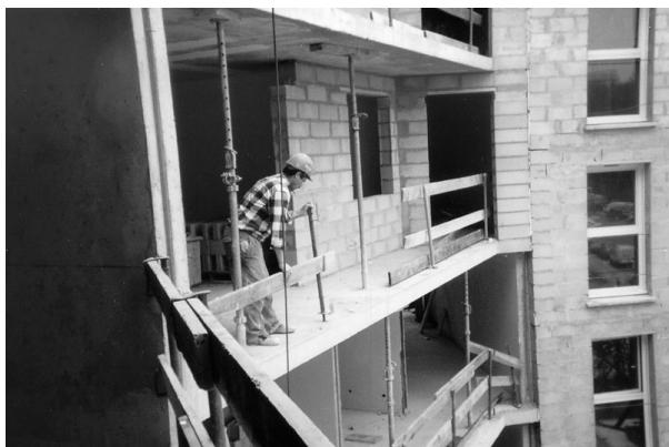
Réception de la benne.

La même situation est observée lors de l'utilisation de la benne à colle ou lors de l'évacuation des déchets.