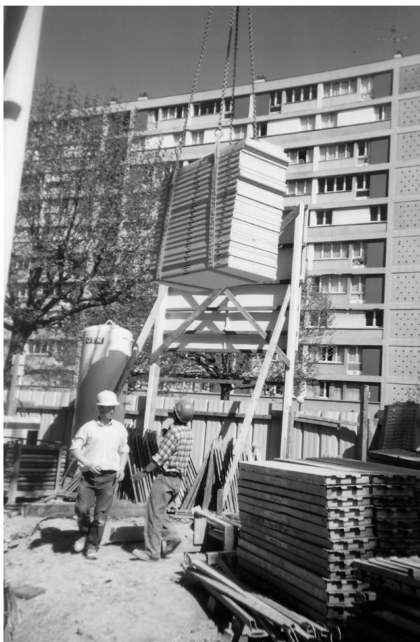
Déplacement de plaques avec la grue

Cependant, le peintre, qui d'habitude procède au transfert de ses articles et de ses échafaudages manuellement, a dû exiger la grue sur le bâtiment 3 car les voies d'accès, réduites à une étroite échelle métallique, ne permettaient pas le passage des approvisionnements tels que les fûts ou les pots de peinture.