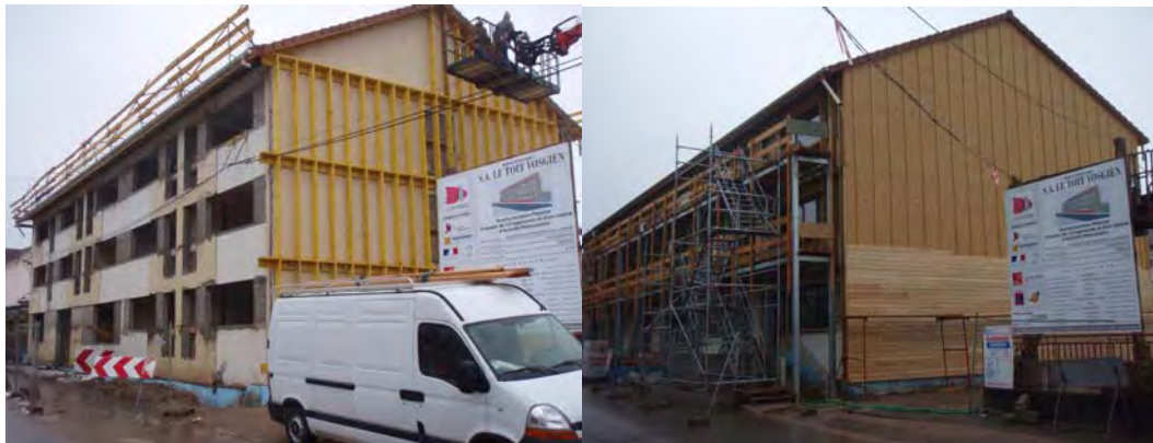
L'opération de requalification menée par Le Toit Vosgien – BET : Terranergie

cours d'obtention et un coût de 1000 €/m 2 HT. Un second foyer du bailleur devrait être traité selon les mêmes procédés.