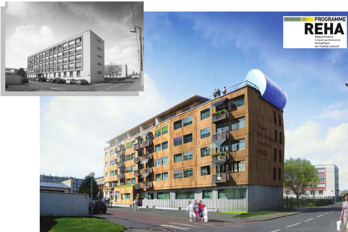
Projet REHA Ecorce - Mandataire