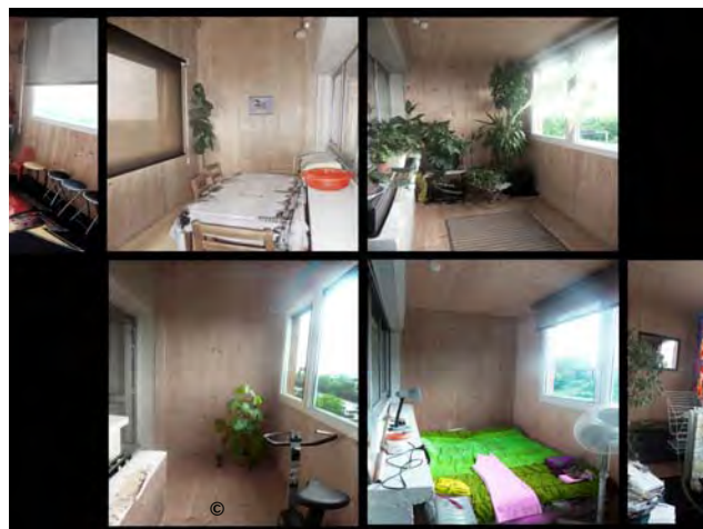
L'opération de requalification de 160 logements à Bondy par la SEMIDEP Architecte : Laurent Pillaud