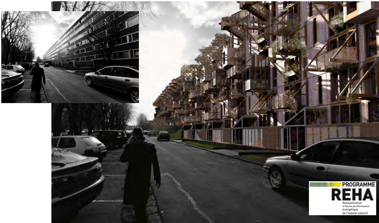
Projet REHA sur la barre Euclide – Mandataire : Ateliers Gens Nouveaux ©

Autre défi relevé dans le cadre de la consultation REHA, un projet de requalification d'une barre de 168 logements à Tourcoing présentant un niveau de consommation moyen de 230 kWh/m 2 /an. Sur ce site qui faisait l'objet d'un projet de démolition-reconstruction par l'Anru, l'équipe a souhaité prendre un tout autre parti : conserver la barre et lui adjoindre un système de façade rapportée incluant des plugs en bois pour créer de nouvelles qualités thermiques et d'usage. Et, en la matière, les objectifs sont élevés, puisque, comme le précisait Vincent Pierré du bureau d'études Terranergie, associé sur ce projet aux Ateliers Gens Nouveaux, « nous visons le niveau passif pour le chauffage (moins de 15 kWh/m 2 /an) ».