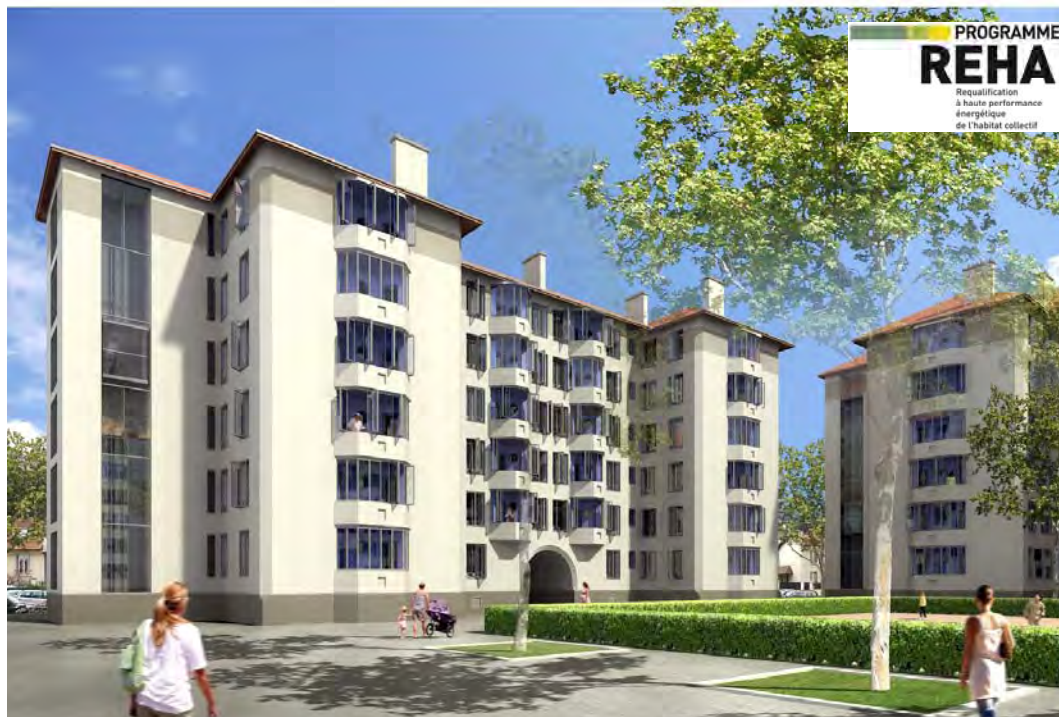
Projet REHA Effi-HBM Mandataire : Rouillat architectes ©

Seconde intervention, celle de Jean-Paul Rouillat, architecte et lui aussi lauréat de la consultation REHA, qui a travaillé sur la requalification d'un immeuble HBM (Habitat à Bon Marché) ; l'enjeu était ici de préserver les qualités architecturales du bâtiment, tout en apportant des réponses efficaces aux objectifs énergétiques, de confort et d'usage. Cet immeuble HBM avait déjà subi une première vague de réhabilitation partielle.