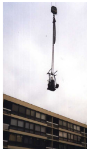
Transport à la grue des bonbonnes de gaz pour les plombiers

La grue est également nécessaire pour monter en terrasse les extracteurs de 200 kg.