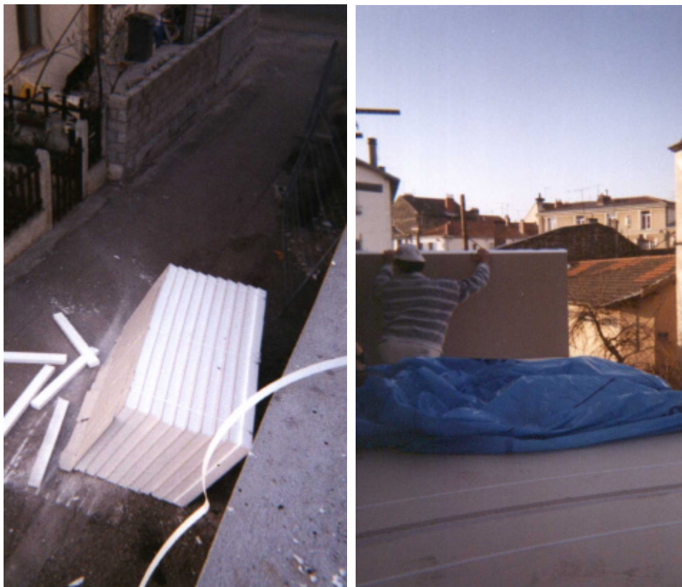
La palette de doublage après sa chute sur la rue de la Cité

bée dans la rue... On peut se le demander d'autant plus qu'ils avaient prévu, comme l'explique le compagnon dans l'entretien, de superposer une quatrième palette, pour apporter en une seule fois la totalité des plaques nécessaires pour les appartements correspondants, ce qui était une prise de risque supplémentaire notée, a posteriori, par le conducteur de travaux Lagorsse : "Ça pèse un poids fou, ça aurait pu traverser le balcon."