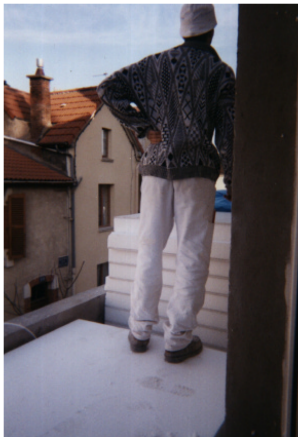
Compagnon plaquiste sur une palette de doublage sur le petit balcon

Le déchargement des plaques de doublage sur l'un des petits balcons donnant sur la rue de la Cité peut également illustrer les difficultés des corps d'état secondaires à bien analyser les conditions de leurs manutentions et à en tirer les conséquences quant aux moyens de levage adaptés. Pour cette livraison de plaques sur les balcons, les compagnons ont utilisé des sangles, ce qui était effectivement le seul moyen possible, l'étroitesse du balcon ne permettant aucunement d'utiliser le lève-palettes comme ils le faisaient pour les recettes. Cependant, les sangles utilisées ne permettaient pas aux compagnons de les désélinguer sans monter sur les palettes, situation dans laquelle ils se mettaient en danger puisqu'ils n'étaient alors protégés par aucun garde-corps du côté de la rue de la Cité.