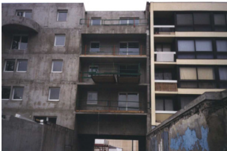
Recettes au dessus du porche, avant et après leur modification