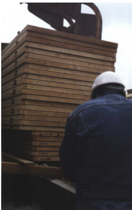
La fourche emporte un lot de 26 portes repalettisé dans le camion

Cependant, les dimensions standard des palettes de chantier sont plus grandes que celles des palettes de portes. Les conséquences de ce surcroît de largeur se sont retrouvées au moment de déposer les palettes ainsi constituées sur certaines recettes. Il a fallu, pour les recettes les plus petites, "casser" le bois des palettes, alors même que celles-ci étaient suspendues à la grue par l'intermédiaire des consoles : "La pile de portes est trop haute pour les lève-palettes. On est obligé de les dédoubler pour les mettre sur une fourche. C'est un problème de hauteur, voire un problème de poids quand on a beaucoup de portes lourdes sur une palette. On ne peut pas imaginer de palettisation par étage, je vois mal douze portes par palette dans une livraison en semi ; ça mobiliserait tout un plateau. Quand on les dédouble, nous, on peut en profiter pour les faire correspondre avec les étages, mais on n'aurait pas besoin de les reconditionner si la hauteur des palettes était moins importante" (compagnon menuisier). Il est important de souligner qu'en dépit de toutes ces difficultés et improvisations coûteuses et, pour certaines, risquées, les menuisiers se déclaraient satisfaits de pouvoir disposer de la grue et des recettes car la situation la plus générale pour eux est celle où la totalité des manutentions est réalisée manuellement !