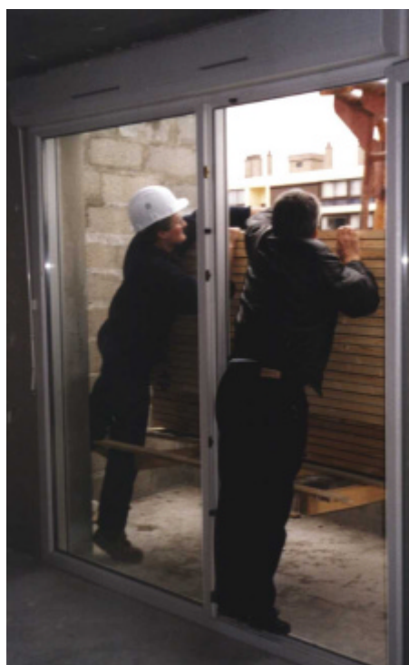
Les menuisiers réceptionnent la palette

Il faut noter que le responsable de l'entreprise de menuiseries intérieures n'a pas anticipé ces difficultés. Il avait prévu un déroulement de la livraison selon lequel la grue prend une palette pleine et la dépose sur une première recette. Là les menuisiers déchargent le nombre de portes correspondant aux besoins de l'étage, puis la palette, avec le reste de portes, est reprise par la grue pour passer à l'étage suivant, et ainsi de suite. Il prévoyait pour la livraison de 134 portes un temps de manutention de l'ordre d'une heure à trois heures, plus le chauffeur du camion (une personne dans le camion pour faire l'élingage et le décolisage avec l'aide du chauffeur et deux personnes à la réception). Ce temps a été presque doublé (il a fallu 1 h 50 pour déplacer et rentrer toutes les portes) par les difficultés rencontrées et les moyens qu'il a fallu improviser pour décharger.