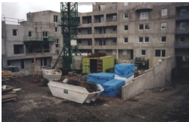
Plaques de doublage stockées à l'extérieur dans l'attente de leur manutention avec la grue

C'est ce lot qui sollicite le plus la grue du chantier mais la plupart des matériaux peuvent supporter un stockage intermédiaire. Les plaques de doublage et de cloisons sont livrées par le camion-grue de l'entreprise et stockées en extérieur en attente de la disponibilité de la grue pour approvisionner par les recettes les différents niveaux. Généralement les sacs de 25 kg de colle, pour fixer les doublages, sont livrés en même temps et manutentionnés de la même façon avec la grue.