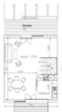
1er ETAGE 32.45