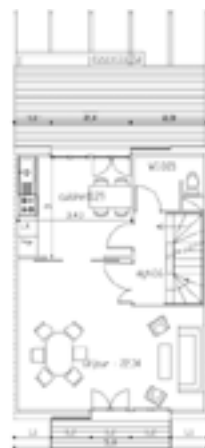
1er ETAGE 39.28