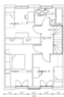
2eme ETAGE 38.6