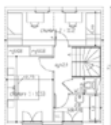
2eme ETAGE 31.81