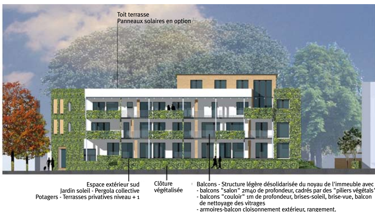
ÉLEVATION SUD 1_200 GIES ARCHITEKTEN BDA

Sous-sol : béton Etages : structure en bois massif