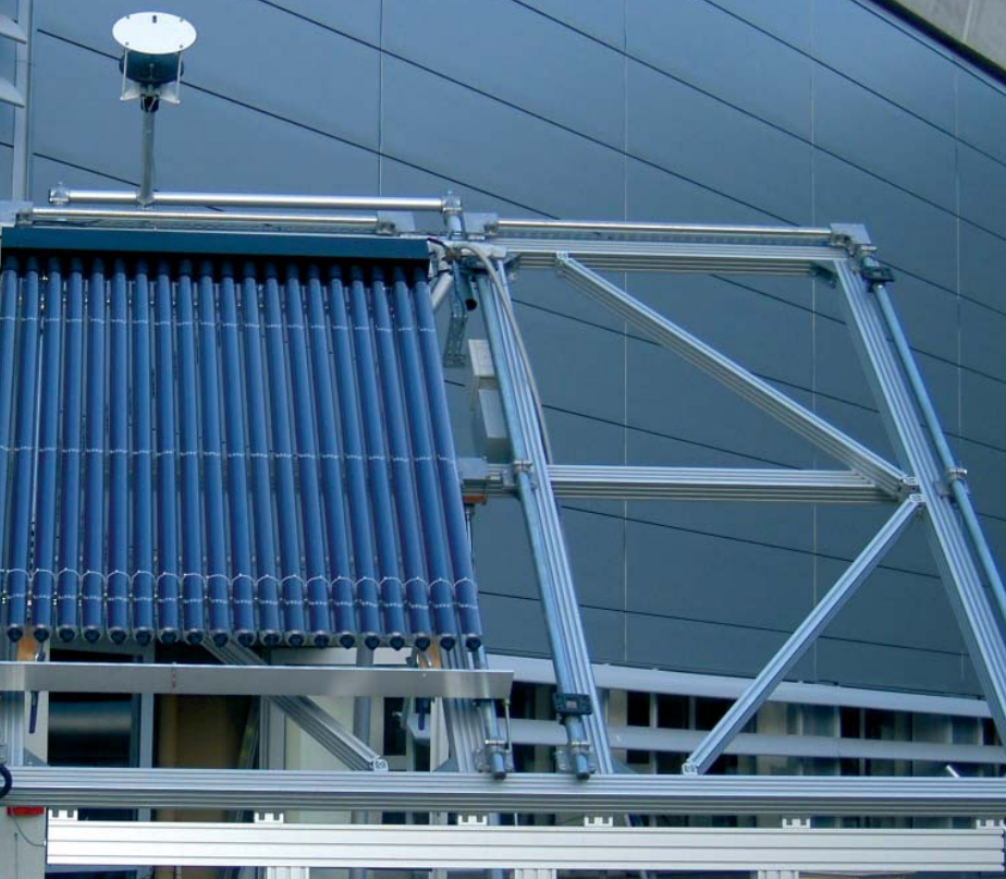
☒ Capteur solaire en cours de test de résistance au vent (CSTB Champs/Marne)