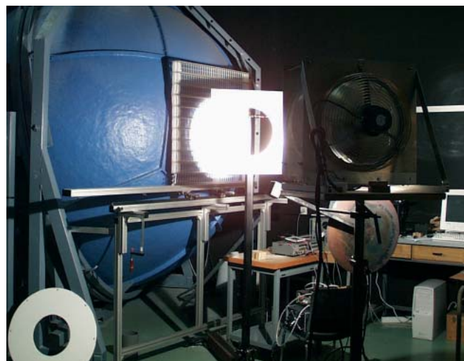
☒ Plate-forme Optora