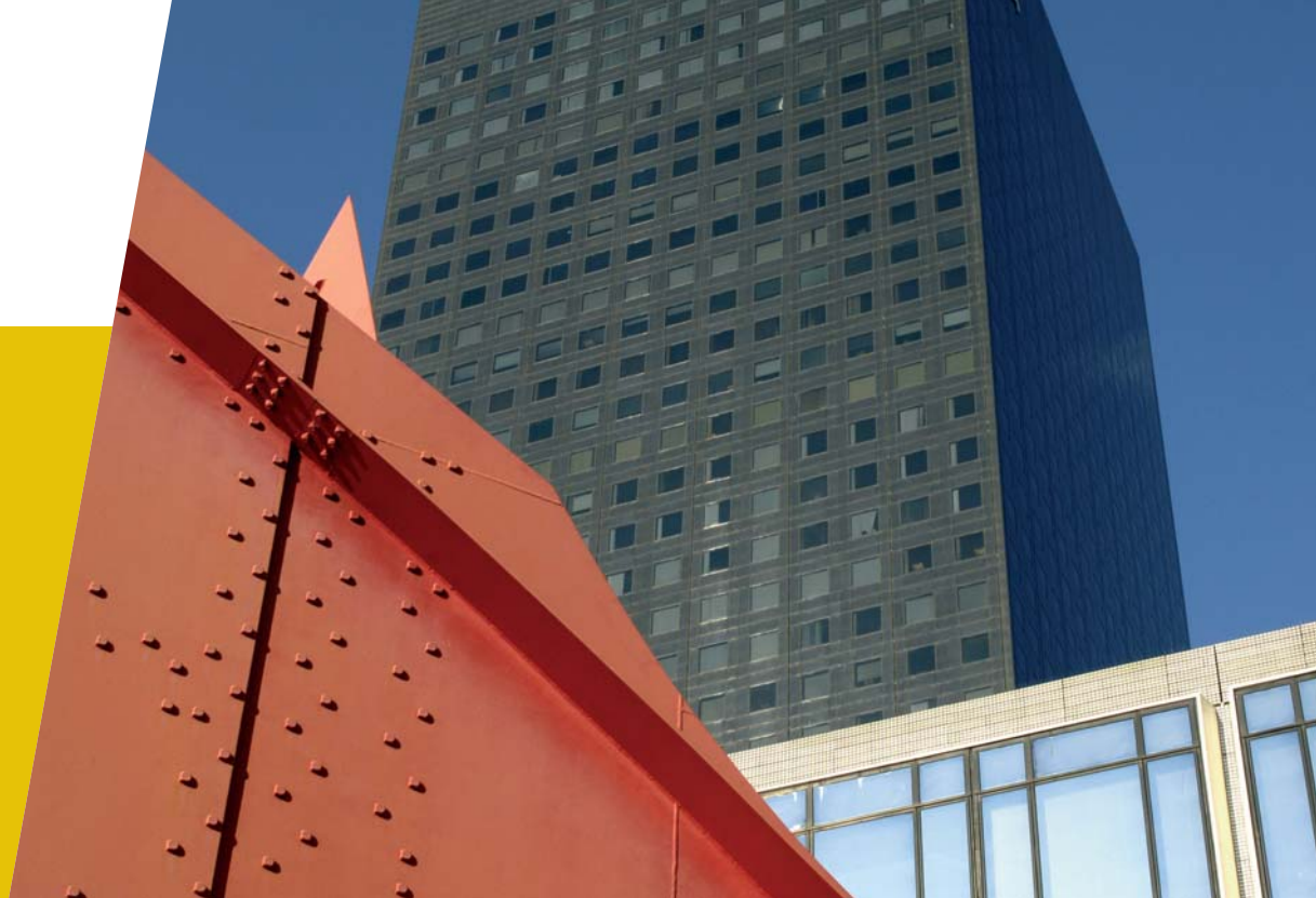
Plate-forme sur la durée de vie des produits de construction

Connaître la durée de vie des composants est aujourd'hui une donnée indispensable pour concevoir et gérer des ouvrages dans une optique de développement durable. Restait à créer un outil pour capitaliser et mutualiser les informations utiles à la connaissance de la durée de vie des produits de construction. C'est chose faite avec la "plate-forme sur la durée de vie des produits de construction" réalisée par le CSTB avec le soutien du ministère du Logement. Son rôle : servir de passerelle interactive entre les spécialistes "produits et composants" et le monde des gestionnaires, utilisateurs ou concepteurs d'ouvrages.