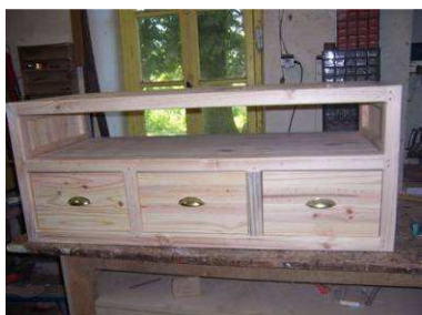
Pose des poignées.

Meuble en cours de finition dans l'atelier. J'ai utilisé un vernis teinté type « aquaréthane ».