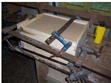
Collage du tiroir.

Et oui, il faut poncer... Ne faites pas comme moi : j'ai oublié de mettre le filtre à poussières.