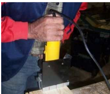
Utilisation de la lamelleuse.

Les côtés sont assemblés avec des lamelles. Le fond du tiroir est en MDF (médium) de 5 mm d'épaisseur. Le fond est inséré dans des rainures réalisées à la défonceuse.