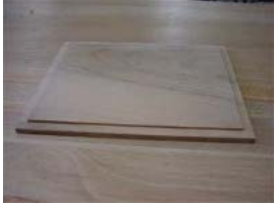
Photo 3 : Fond du cadre ; Il a été travaillé pour pouvoir s'encaster dans le cadre. Il peut être remplacé par un CP de 5 mm (dans ce cas, il faudra prévoir deux carrelets de 10 mm pour fixer les pitons)