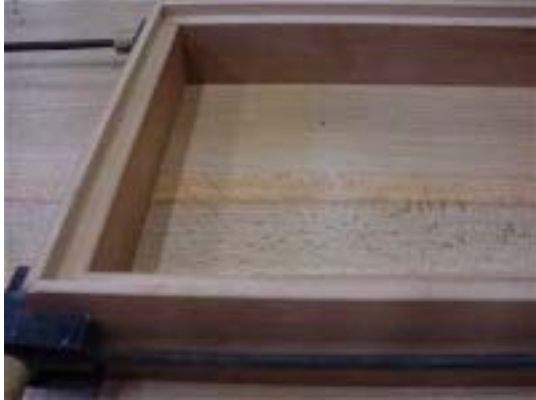
Photo 2 : Dessous du cadre de la boîte à clefs. Les quatre morceaux sont collés.