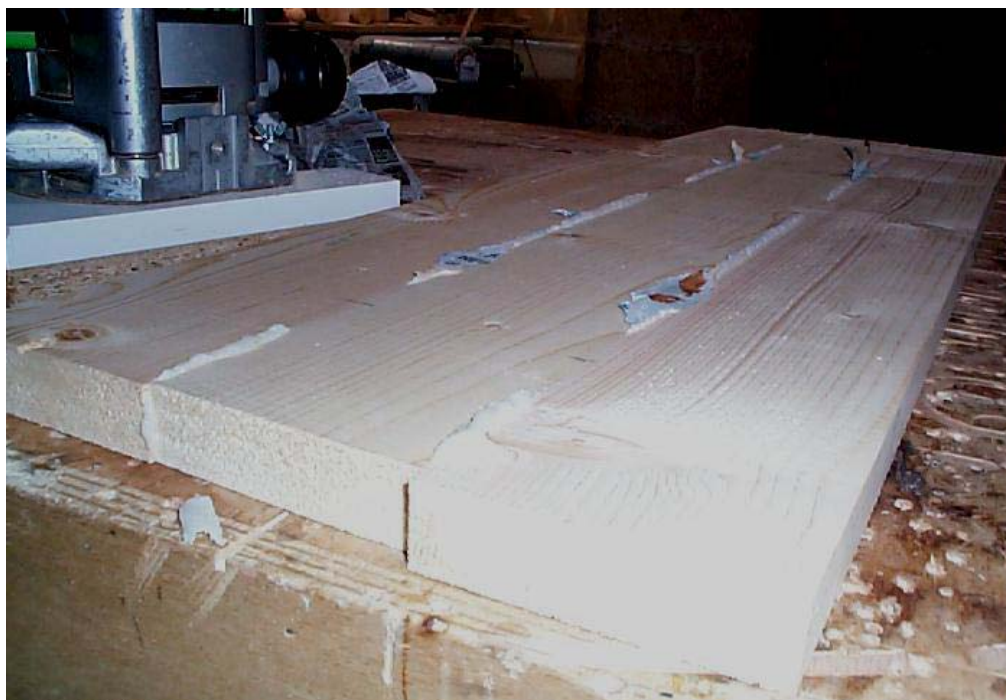
Un panneau avec les excédents de colle

Soit j'utilisais un ciseau à bois et j'en avais pour un bon bout de temps, soit je trouvais une autre solution qui me permettait d'aller très rapidement. J'ai donc choisi cette dernière solution en fabriquant un dispositif d'affleurage utilisable avec ma défonceuse.