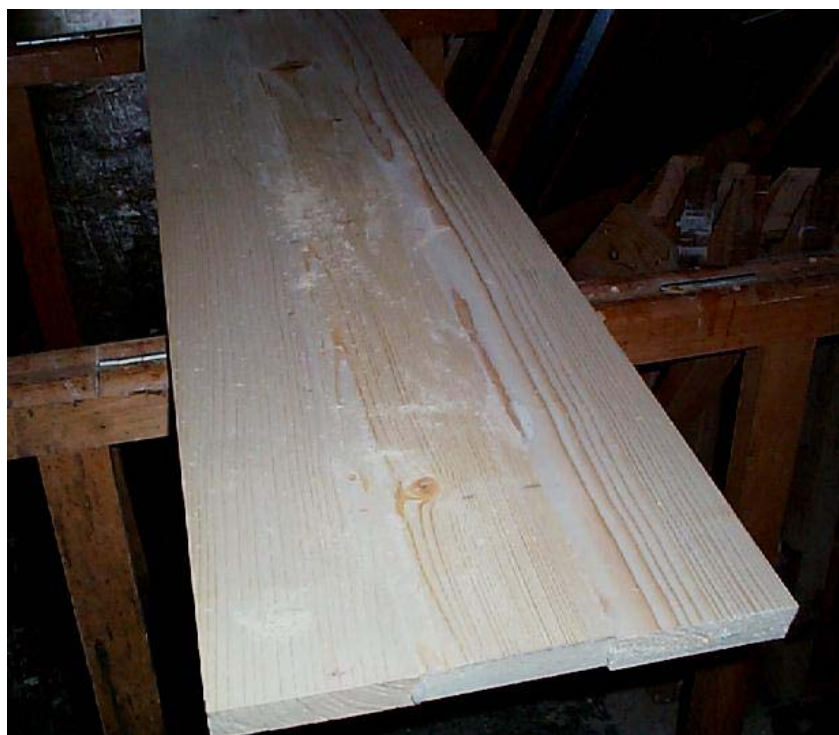
Un panneau après affleurement des excédents de colle