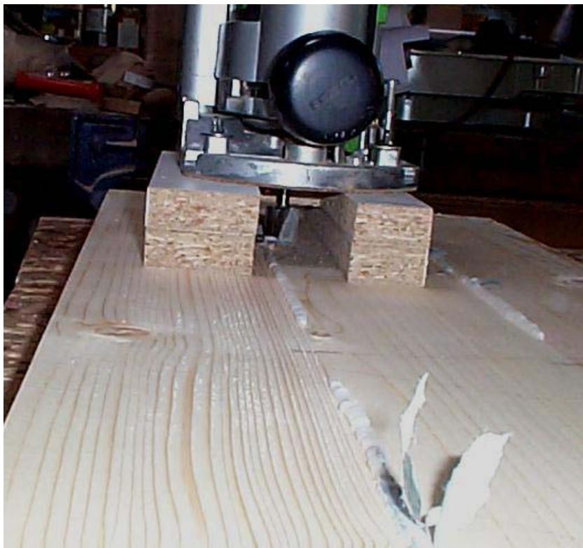
La défonceuse en position de travail

Positionner l'ensemble « à cheval » sur le joint à affleurer et fraisez.