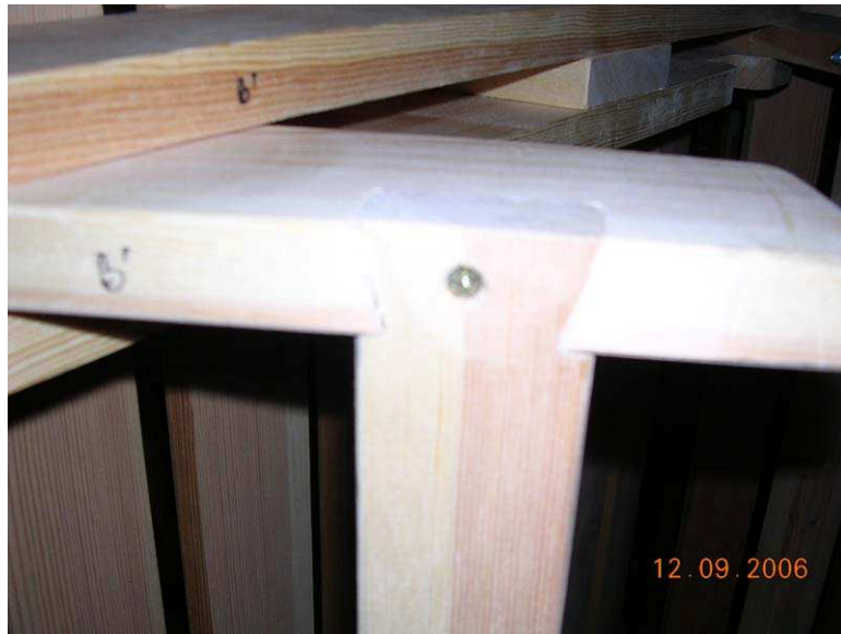
Détail de la queue d'aronde pour l'assemblage des traverses de pieds repliables.