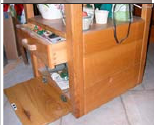
Vue du coffre bas ouvert. On remarque l'assemblage du caisson tiroir. Les poignées sont également réalisées « maison ». On peut également voir les arrondis de 5 des montants et des cotés.