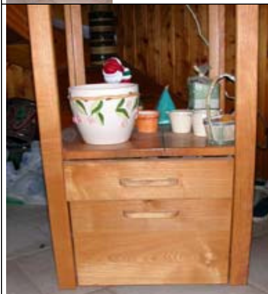
Vue du coffre bas avec le tiroir et l'abattant. Le tiroir coulisse sur une plaque de CTP de 10 fixée entre les montants.