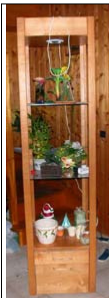
Vue de l'étagère entière.