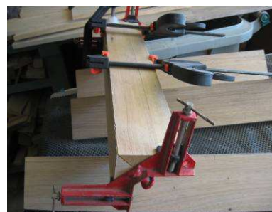
Collage d'un pied

Les cadres sont assemblés par collage et vissage sur les pieds (8 vis suffisent pour un cadre complet, elles servent à renforcer, mais aussi facilitent la mise en place et le collage).