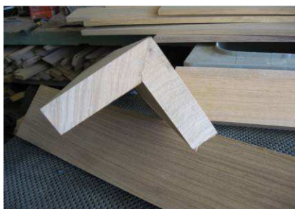
Vue en bout d'un pied