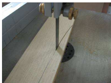
Découpe des cadres

Ils sont débités dans des sections de 80 x 12 mm. Les arrondis inférieurs sont réalisés à la scie à ruban, le premier morceau de chaque côté sert de gabarit pour tracer les autres, et je me suis servi d'un régllet souple pour tracer les premiers. Le début et la fin du traçage commencent à l'arête de chaque pied.