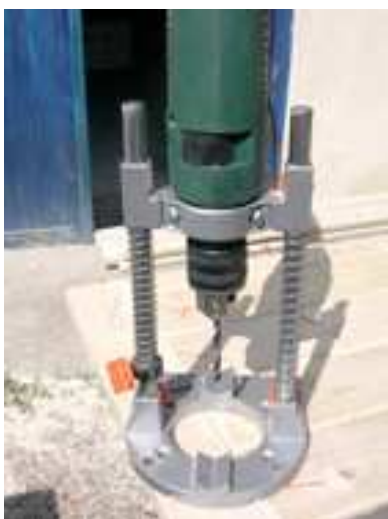
Photo 7 La perceuse montée sur son support pour faire les trous permettant d'enfoncer les chevilles qui sont collées à la colle P.U.

Les champs sont poncés au rouleau ponceur monté sur la toupie.