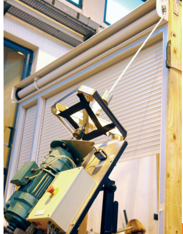
Banc d'ensoleillement : les tabliers sont soumis durant 6 heures à des températures de 50° pour les tabliers blancs et clairs et 70° pour les tabliers foncés, puis subissent des chocs thermiques.