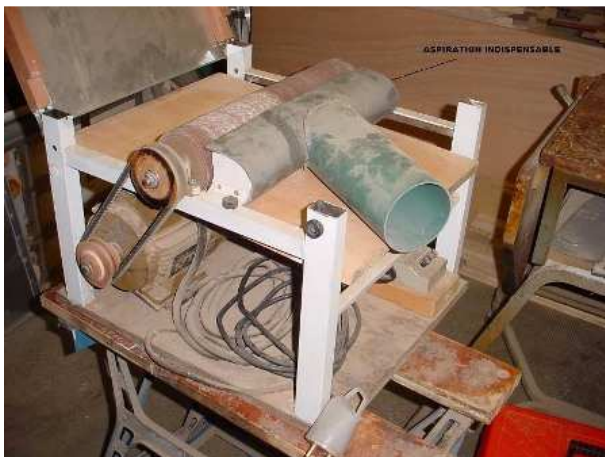
Le bâti est réalisé en tube (4 X 2,5) et en cornières de 2,5 soudées à l'arc