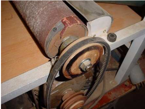
Vue de la poulie et de la rainure pour engager l'abrasif.

Par sécurité : un contre écrou « anti-dévisage » (scié au \frac{3}{4} ). Sur cette photo, on voit aussi le collecteur à poussières.