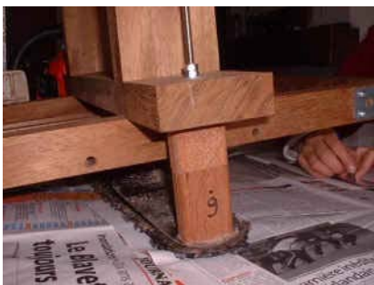
manchon de réglage d'épaisseur de la tige filetée ; blocage sous le guide et sur le support