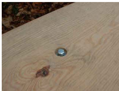
tire-fonds encastré pour fixation par dessus