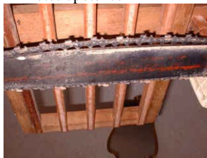
vue de dessous