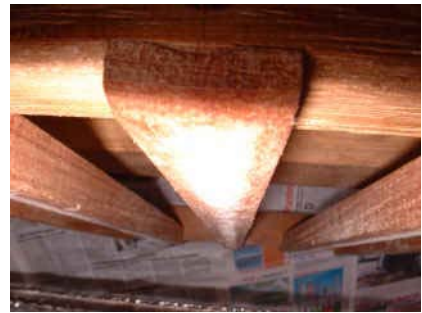
détail d'un patin vue dessous