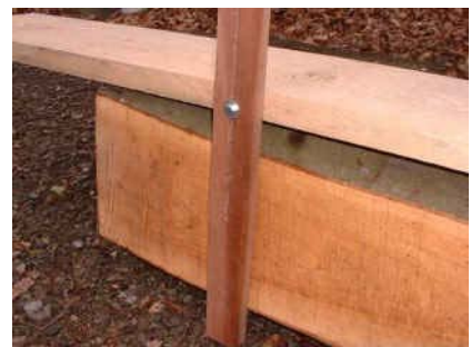
pied fendu pour réglage de hauteur