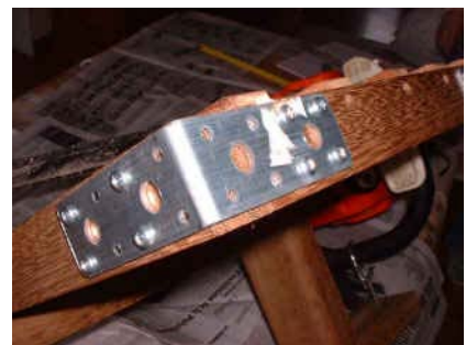
équerre de renfort