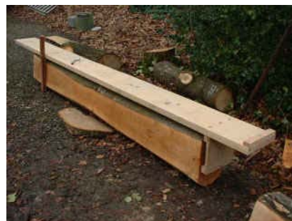
la planche guide de 1 ère coupe en place