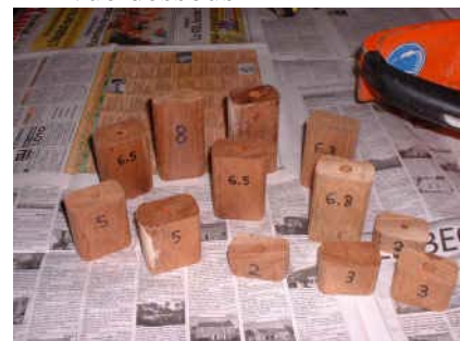
différentes longueurs de manchons :on combine