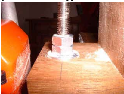
détail blocage : rondelle, écrou, contre-écrou