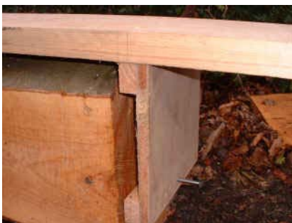
planchette pour fixation en bout.