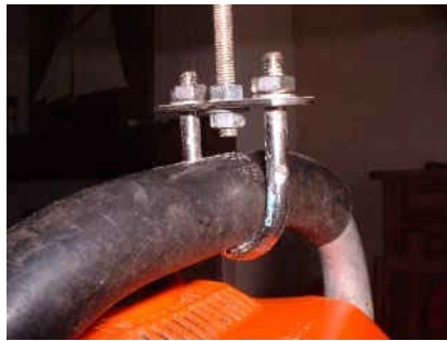
attache suspension moteur/potence