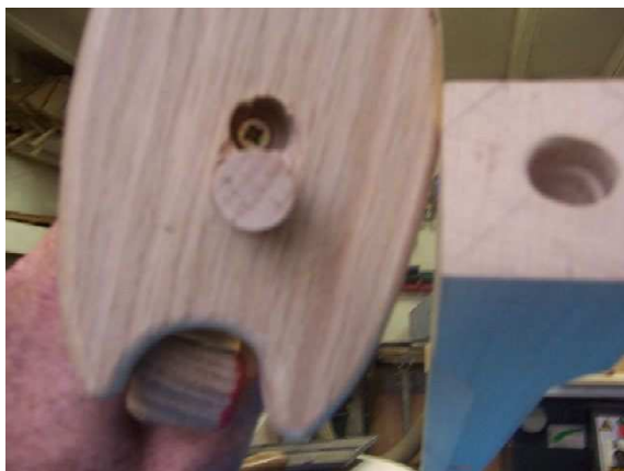
Détail de la fixation du motif principal au mat