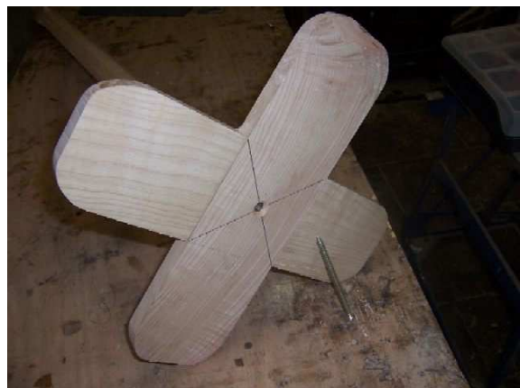
Fixation du pied au mat